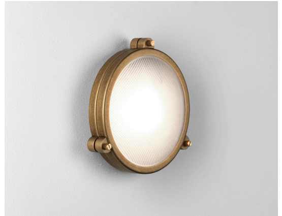
CODE: 1387003 FINISH: SOLID BRASS

THIS PRODUCT IS NOT SUITABLE FOR INSTALLATION WITHIN FIVE MILES OF THE COAST. FOR THESE ENVIRONMENTS, PLEASE FILTER PRODUCTS ON THE ASTRO WEBSITE BY 'COASTAL'.